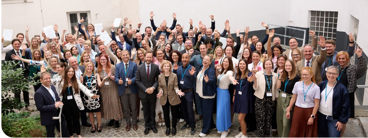
BMFWF und OeAD verliehen zum achten Mal die Young-Science-Gütesiegel