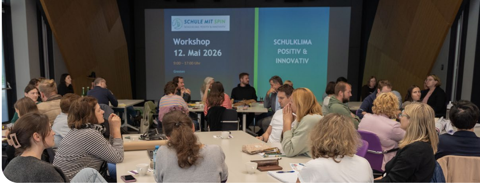
Schule mit SPIN Vernetzungstreffen