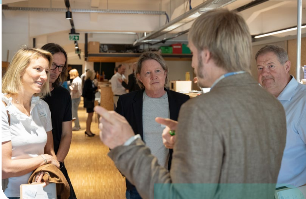
Schulbesuch des ORG ROSE im Rahmen des IDEAS-Community Events in Linz

Alle diese Projekte verbindet eine gemeinsame Überzeugung: Bildungsinnovation entsteht nicht durch fertige